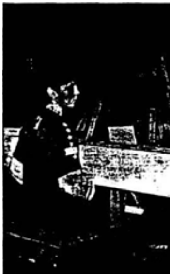
Lerneten Betriebe Ihrer Wahl kennen: Schnupperlehrlinge der HS Bludenz-West.