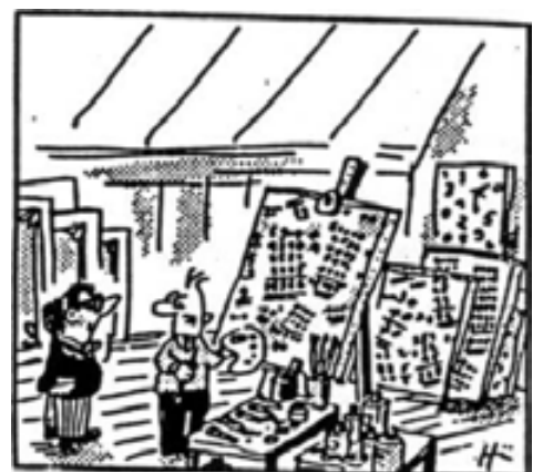
Peter Hürzeler im «Tagesanzeiger»