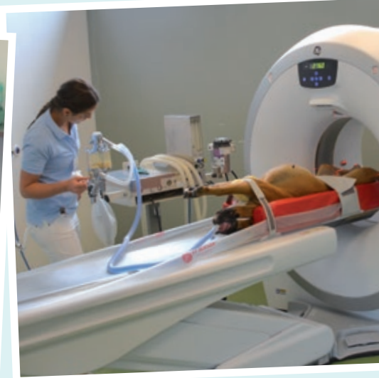
Kontrolle während der Computertomographie