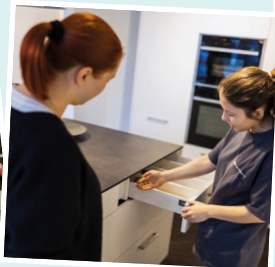
Gestaltung im Detail besprechen