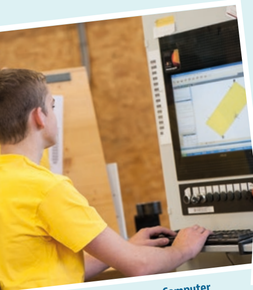
Produktentwicklung am Computer