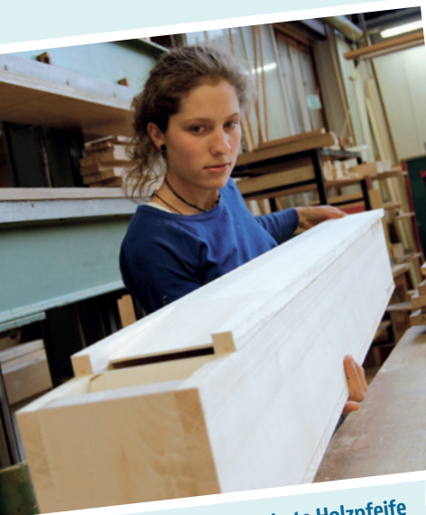
eine frisch verleimte Holzpfeife aus der Presse nehmen