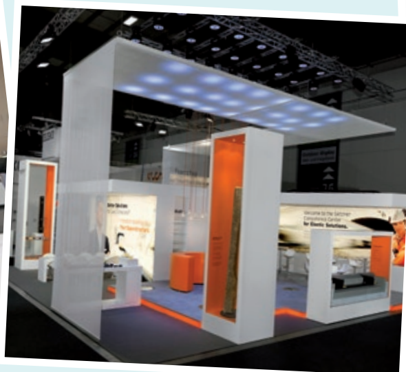
fertig designer Messestand