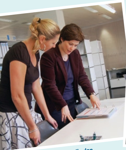
sich mit der Kundin den Themenüberblick verschaffen