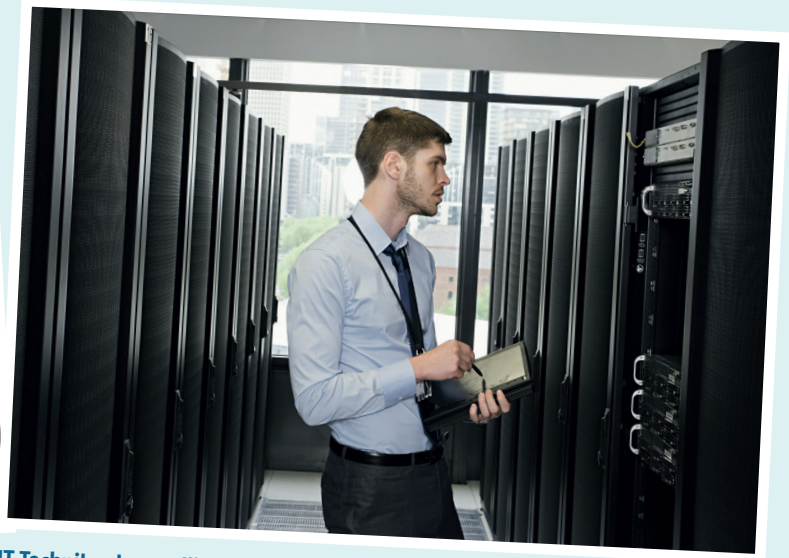
IT-Techniker kontrolliert im Serverraum