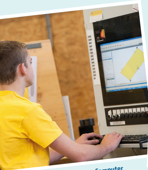
Produktentwicklung am Computer