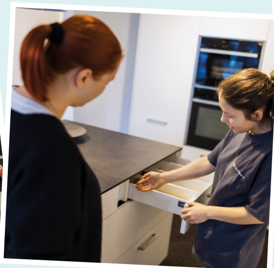
Gestaltung im Detail besprechen